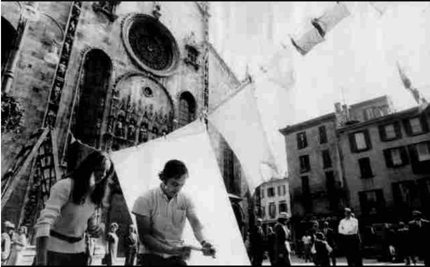
Campo Urbano, Como 1969