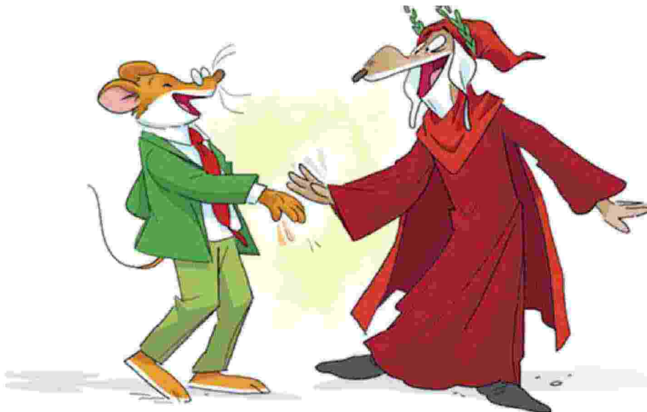
«Diamoci il cinque!» Un incontro epico: Dante e Geronimo Stilton in "Il mio amico Dante" (Piemme)

Un sorprendente viaggio nella "colorata selva" dell'editoria per i più piccoli